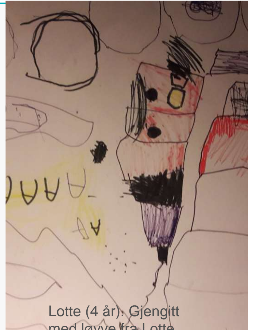
Lotte (4 år). Gjengitt med løyve fra Lotte.