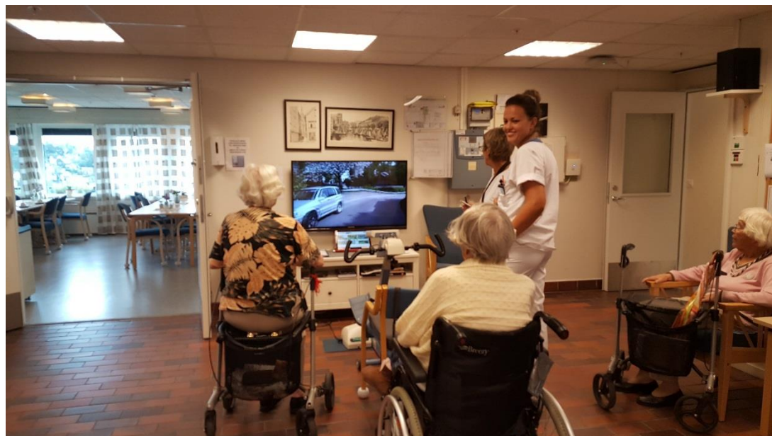
Gøy med nye lokale filmer