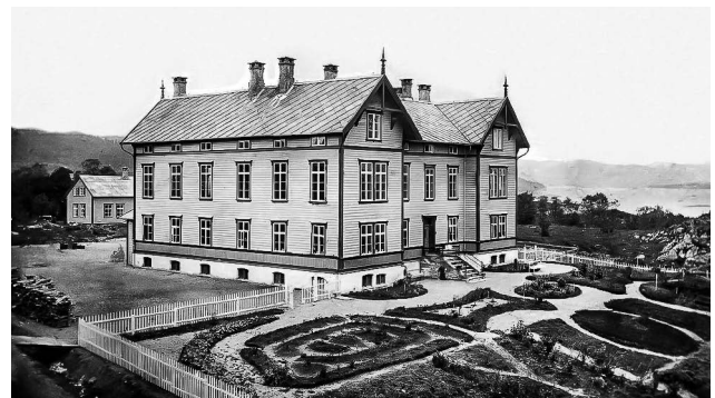
Seminarbygningen ca. 1880

Det er i denne andre fasen seminaret flyttar frå Tyse til Rommetveit. Heller ikkje denne gongen er Leirvik på tale som skulestad endå strandstaden har gjennomgått ei markert utvikling. I 1857 var t.d. ei ny, stor kyrkje reist og i 1864 stod det imponerende kretsfengselet ferdig. Sakførarar og handelsmenn hadde etablert seg, og telegraf og postkontor var på plass. Det som truleg var avgjerande for plasseringa var at staten sidan reformasjonen hadde ått Øvra Rommetveit. Her fekk seminaret tomt ved å overta to gardsbruk på om lag 130 mål - knapt to kilometer frå prestegarden.