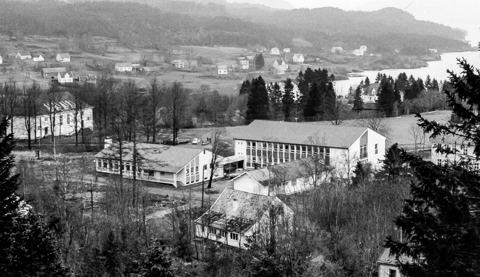
Første steg i den store utbygginga på 1960- og 70-talet var velferds- og spesialrombygga. Til venstre gymnastikksalen frå 1922. I framgrunnen Daae-huset