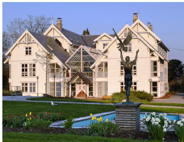
Det gamle hovudbygget med påbygget frå 1995

HSH vart altså berre eit 23 år langt mellomspel, men samanslåinga av lærarutdanninga og sjukepleiarutdanninga på Stord førte med seg ikkje berre behov for nye administrasjonsbygg, men også behov for nye undervisningslokale. Det får ein i 2004 ved eit nytt bygg for sjukepleiarutdanninga med postmodernistiske trekk. Link arkitekter og S. Halleraker står for utforminga. Dermed vert det nye gardsrommet ved gymnastikkbygget komplett.