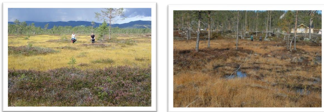
Figur 1. To myrer i Viken fylke. Bjørkemåsen i Nannestad til venstre (august 2021), og ei myr ved Tururfjell, Flå kommune til høyre (oktober 2019). Disse myrene vil enten gå fullstendig tapt, eller bli vesentlig forringet på grunn av utbygginger til bolig- eller fritidsboliger, med betydelige utslipp av CO 2 som en konsekvens.

Myr er et økosystem med et høyt grunnvannsspeil og med fuktighetskrevede vegetasjon som danner torv (Fig. 1). Det høye grunnvannsspeilet og det stagnerende vannet i myr fører til oksygenmangel i torvjorda, noe som gir svært lave nedbrytningshastigheter av biologisk materiale. I velfungerende myr vil planteproduksjonen være høyere enn nedbrytninga, og torvjorda i myra vil bygge seg opp, kanskje så mye som 0,5-1 mm i året (Flatberg 2013). Torvjord er gjennomtrukket av vann, og den dannes av de døde plantene (og dyra) på myra, og består hovedsakelig av ufullstendig nedbrutt organisk materiale, som igjen består av ca. 50% karbon. Dette er grunnen til at myr kan inneholde store mengder karbon.