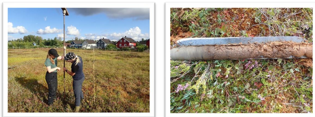
Figur 4. Bruk av russerbor for å ta opp torvprøver for å bestemme volumtettheten på torva og karbonkonsentrasjonen. Bjørkemåsen i Nannestad kommune, august 2021.

2010). For å unngå å overestimere karbonlageret har jeg valgt å bruke verdier som ligger mellom 0,060 – 0.090 g/cm 3 .