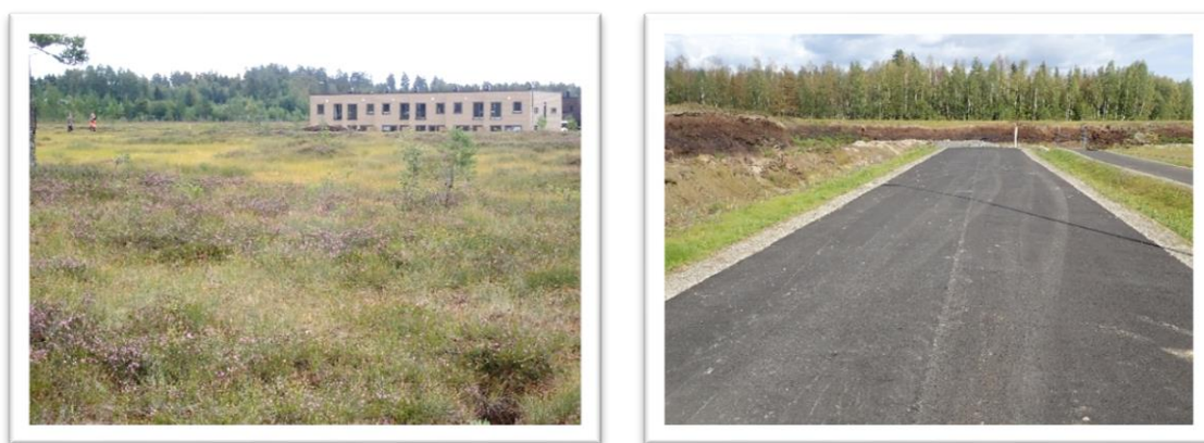
Figur 3. Bjørkemåsen i Nannestad kommune (august 2021), var en gang en stor høgmyr på 625 daa som het Præstmosen. Den er etter flere boligutbygginger i ferd med å forsvinne helt, med store CO 2 -utslipp som konsekvens.

er likevel velkjent at intakt høgmyr har store karbonlagre (Joosten et al. 2015; Lyngstad et al. 2015), slik som Bjørkemåsen i Nannestad kommune (Fig. 3) uten at dette er hensyntatt i planprosessen (Andersen & Moland 2022; Fjellengen 2022). Bjørkemåsen er en del av det som engang het Præstmosen som hadde et areal på 625 daa (Stangeland 1892). Præstmosen er gradvis gravd opp gjennom flere boligutbygginger, med store CO 2 -utslipp som konsekvens. Det siste byggetrinnet pågår nå, og det er estimert at det totale CO 2 -utslippet til slutt vil komme opp i 220-230 000 tonn CO 2 e (Andersen & Moland 2022; Fjellengen 2022).